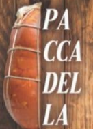
MORTADELLA & PACCASASSI