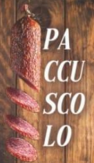
SALAME MORBIDO & PACCASASSI